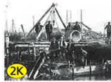
Velweg Bern - Thun Gürbe